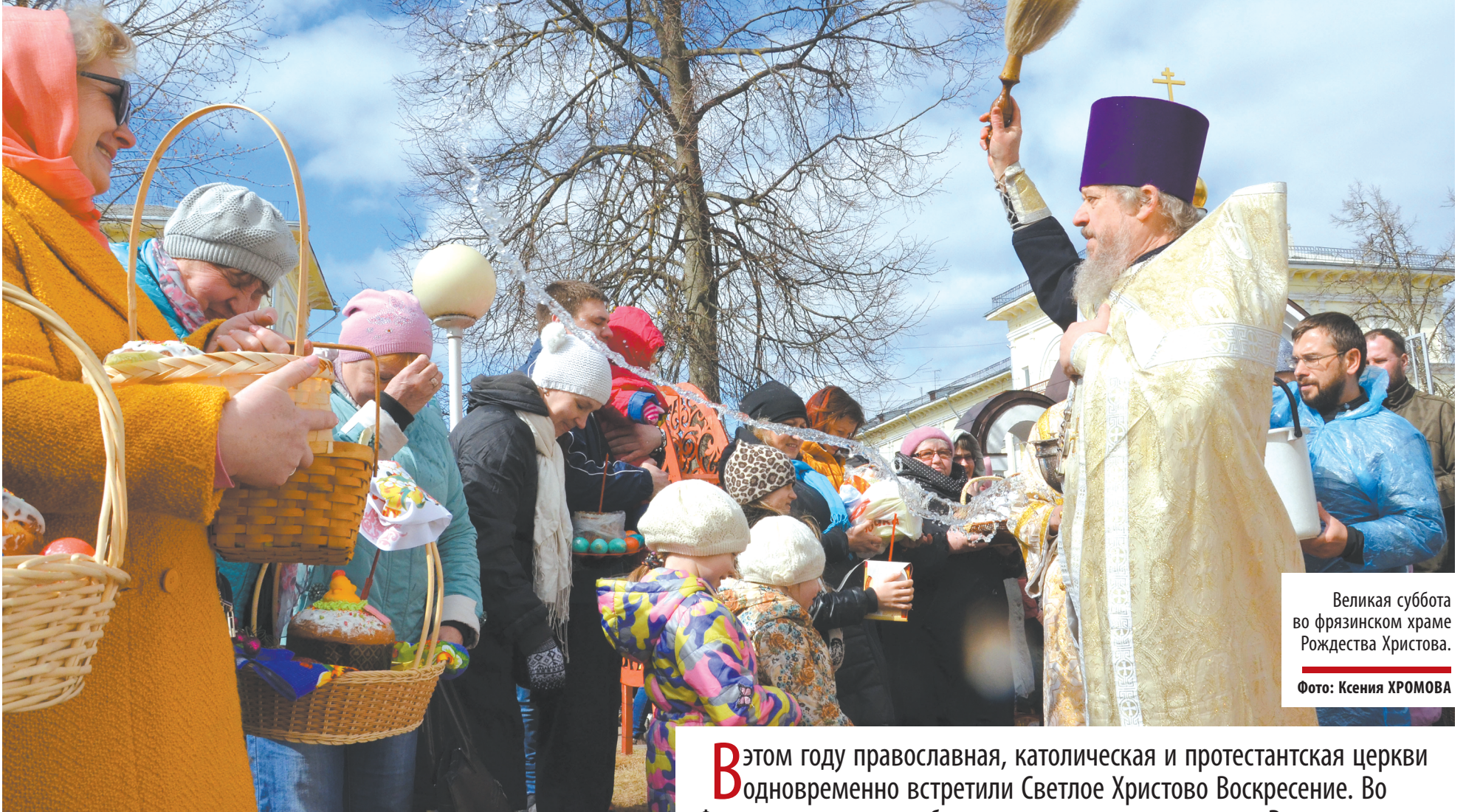
Великая суббота во фрязинском храме Рождества Христова.